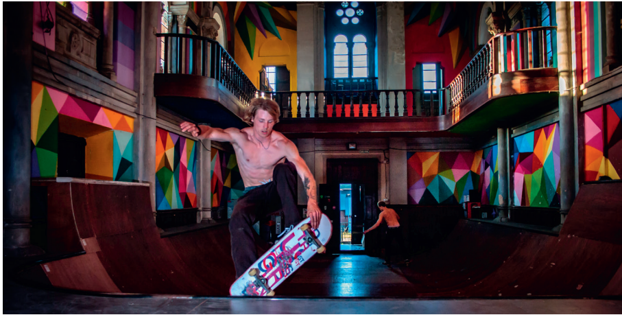
Wie stark muss Kirche sich ändern, um immer wieder neu die Botschaft des Jesus von Nazareth zu uns Menschen zu tragen.