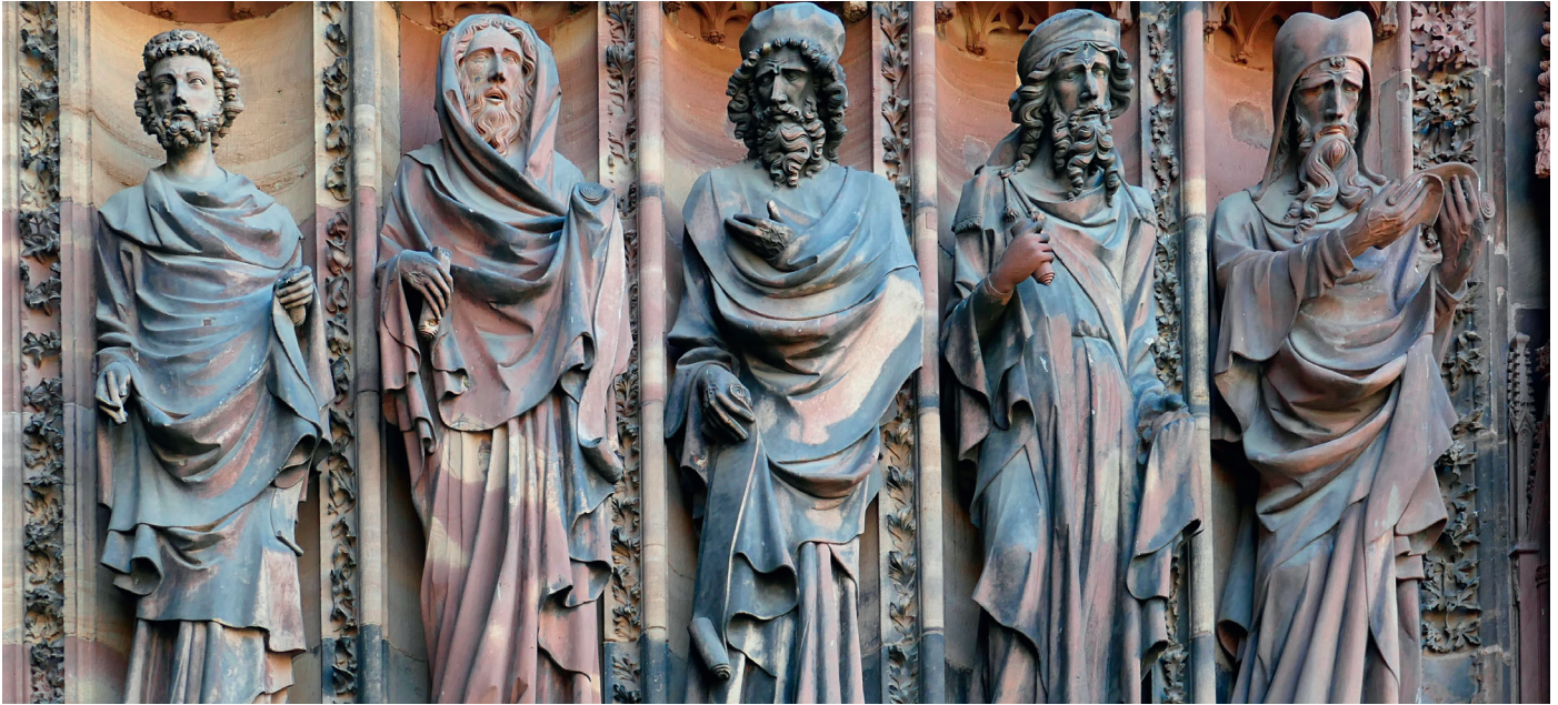
Greta Thunberg in einer Reihe mit den Propheten, hier am Westportal des Straßburger Münsters?