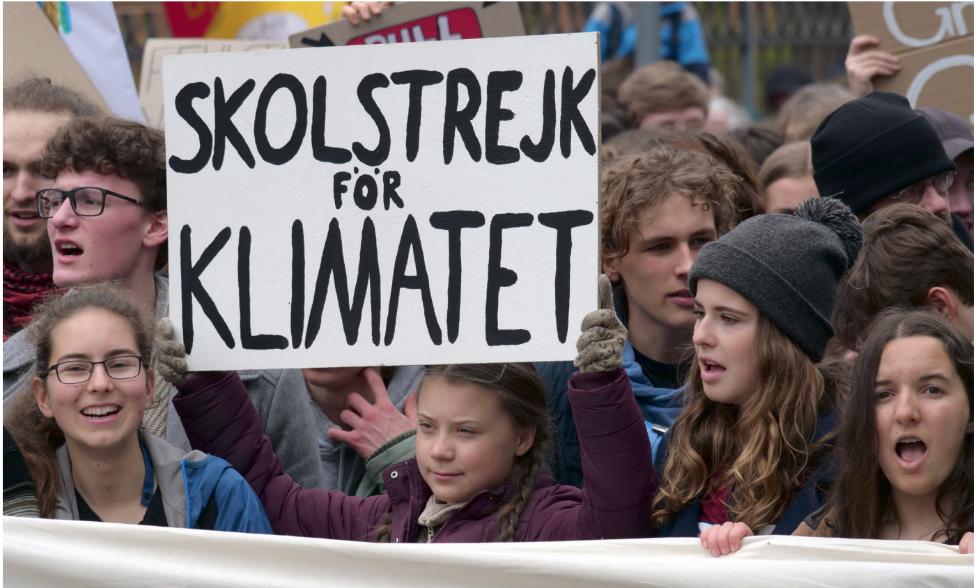
Greta Thunberg, „Fridays for Future“-Demo in Berlin 2019.