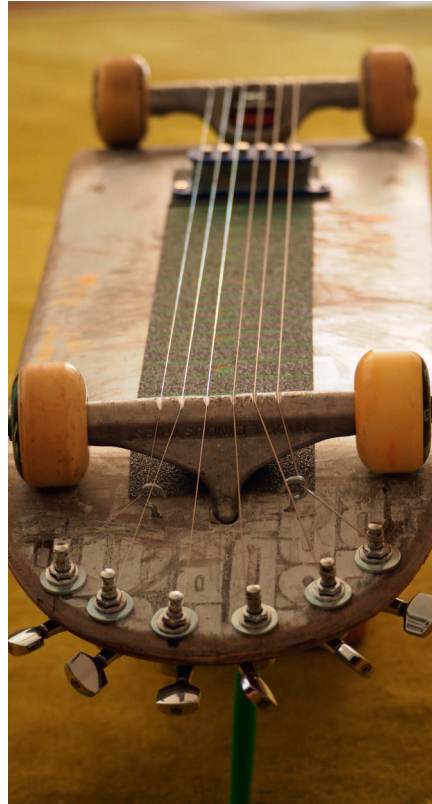
Vor dem Wegwerfen: Aus alt mach neu – upcycling, second hand, d.i.y.