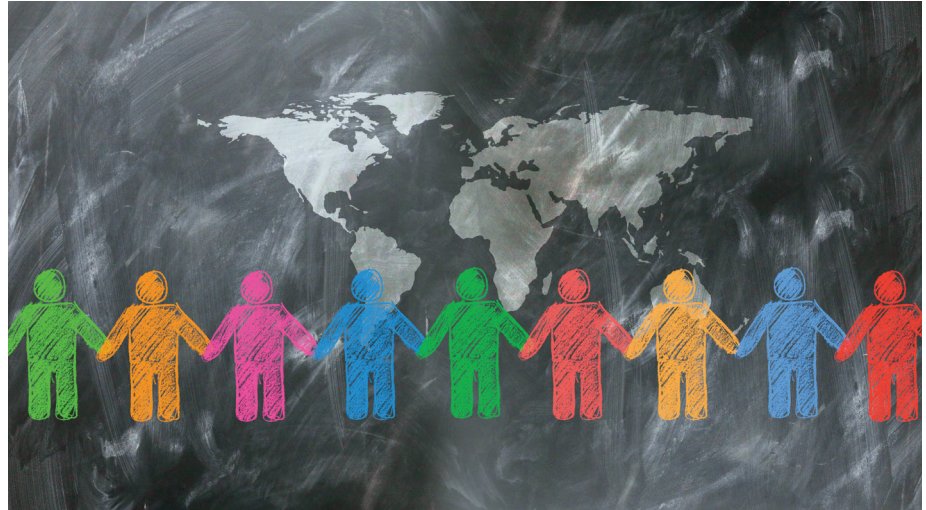
Neue Ökumene: Der Freund in Chile weiß mehr über mich als meine Nachbarin zuhause.

Auch heute bestimmt die sog. multilokale Mehrgenerationenfamilie, 24 eine moderne Fortentwicklung des Hauses – durch vielfältige Kontakte in Social Media ergänzt und erweitert 25 –, die wichtigsten Lebensvollzüge. Weiter gewinnt, vermittelt durch Reisen, aber auch elektronische Kommunikation, die – im