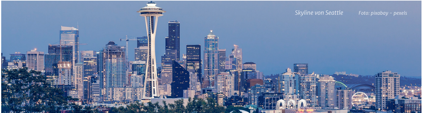
Skyline von Seattle